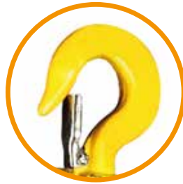
Gancho giratorio con seguro de acero