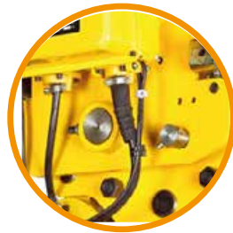
Carro eléctrico Ancho variable