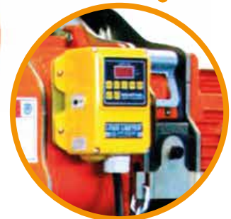
Limitador de carga eléctrico