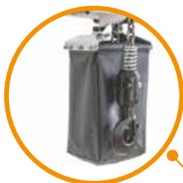
Contenedor de tela Nylon de alta resistencia