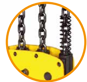
Gancho reforzado Fabricado en acero