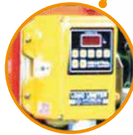
Limitador de carga eléctrico