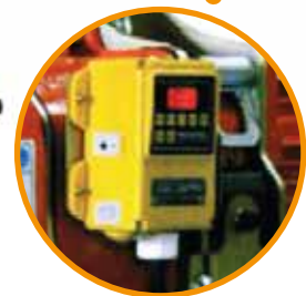
Limitador de carga eléctrico