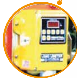
Limitador de carga eléctrico