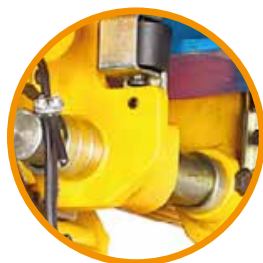
Carro eléctrico Ancho variable