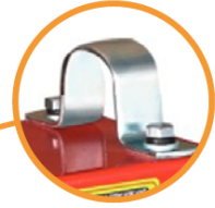
Abrazadera de viga Aleación de acero