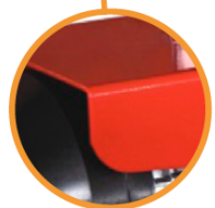
Cuerpo de aluminio Alta resisitencia y menor peso