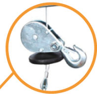
Kit de doble ramal Incluido