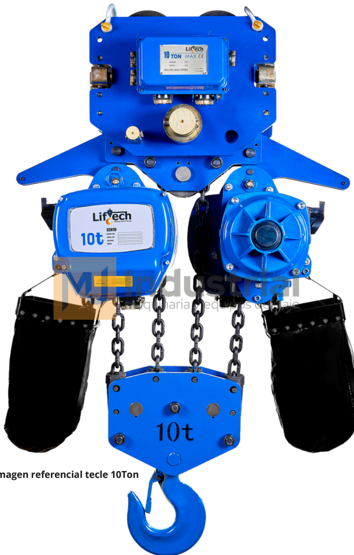
*Imagen referencial tecle 10Ton

Esta equipado con 2 mandos cable e *inalambrico (opcional).