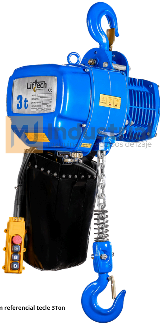
*Imagen referencial tecle 3Ton

Esta equipado con 2 mandos cable e *inalambrico (opcional).