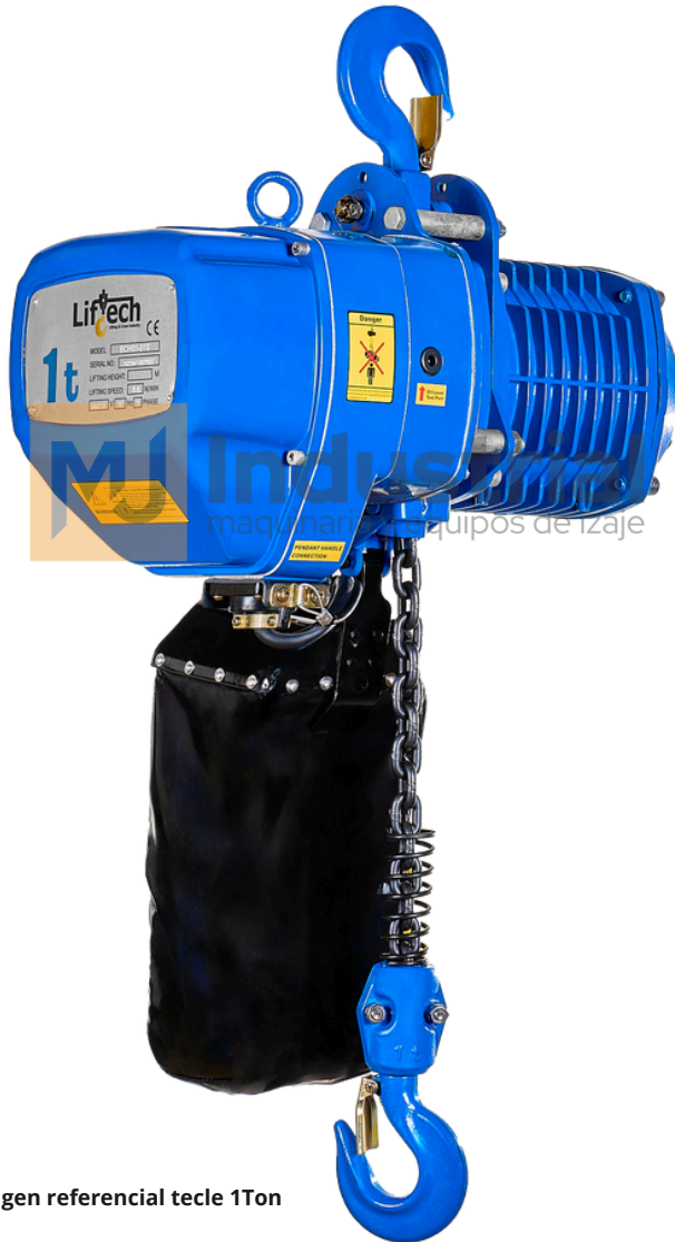
*Imagen referencial tecle 1Ton

Esta equipado con 2 mandos cable e *inalambrico (opcional).